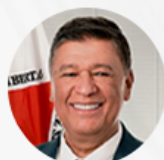
Senador Carlos Viana @carlosviana

Conduzo esta CPMI com seriedade, responsabilidade e alinhamento institucional.