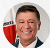
Senador Carlos Viana @carlosviana

Diante da dimensão nacional e da profundidade desse esquema, afirmo que é absolutamente indispensável a prorrogação da CPMI por mais 60 dias. Somente assim será possível aprofundar as apurações, rastrear patrimônio oculto, identificar todos os responsáveis e garantir justiça plena às vítimas.